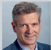
Nationalrat Thomas de Courten Präsident Intergenerika